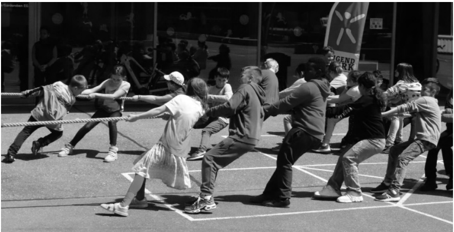
Seilziehen im KIDZZ, angeleitet durch unsere freiwilligen Helfer*Innen