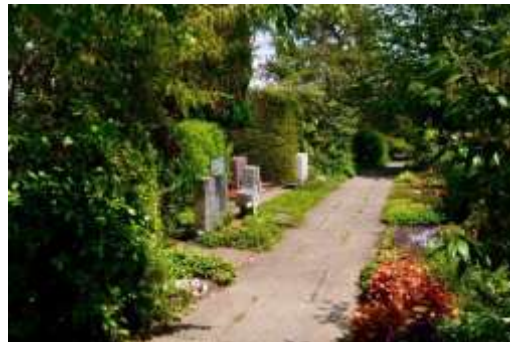
Bilder Friedhof Münchenbuchsee