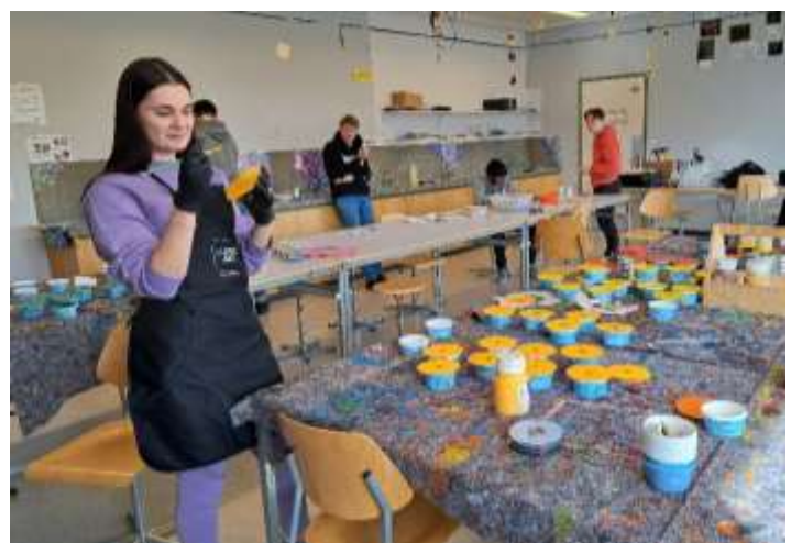
Projektwoche in der Oberstufe im März 2023