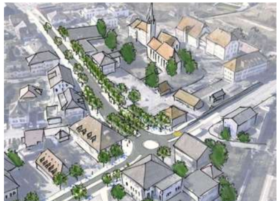
Skizze Moeri + Partner AG aus Projekt Sanierung Zentrumsbereich

1996 erschien das Buch «Münchenbuchsee – Ein Dorf wird Vorstadt». In diesem Buch wurde die Entwicklung Münchenbuchsees von der Land- zur Agglomerationsgemeinde von Bern nachgezeichnet. Das Buch kann bei der Gemeindeverwaltung Münchenbuchsee käuflich erworben werden.