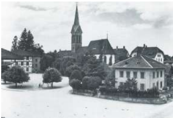
Aufnahme zwischen 1913 - 1928