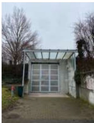
Bilder Zivilschutz Anlage Eggacker

Im Gegensatz zu den vergangenen Jahren wurde die Truppenunterkunft wieder rege genutzt. Durch die Truppen wurden Total 4'684 Übernachtungen registriert. Was ca. doppelt so viel ist wie letztes Jahr. Dafür haben sich die zivilen Übernachtungen halbiert. Im 2022 waren es 600 Übernachtungen im 2023 noch 363.